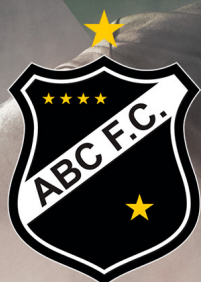
Tabela de Vendas Sócio torcedor ABC F.C.